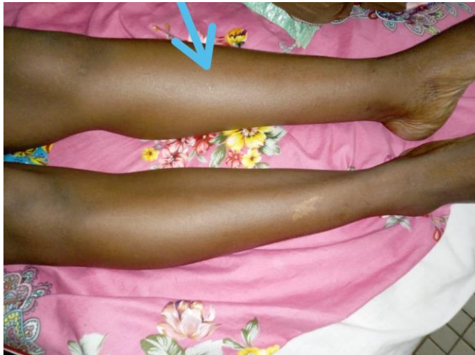
Figure 1 : Tuméfaction du membre pelvien gauche en rapport avec une thrombose veineuse profonde. Aspect j 4 de traitement anticoagulant

artérielle à 120/70mmHg, le pouls à 78 battements/mn, FR à 17cycles/mn, température 37,2 o c, poids à 58kg et un IMC à 23 kg/m 2 . Elle présentait une tuméfaction douloureuse du membre inférieur gauche remontant jusqu'à la cuisse. On notait une douleur modérée à la dorsiflexion du pied (signe de Homans positif) et une diminution de ballotement du mollet (figure 1).