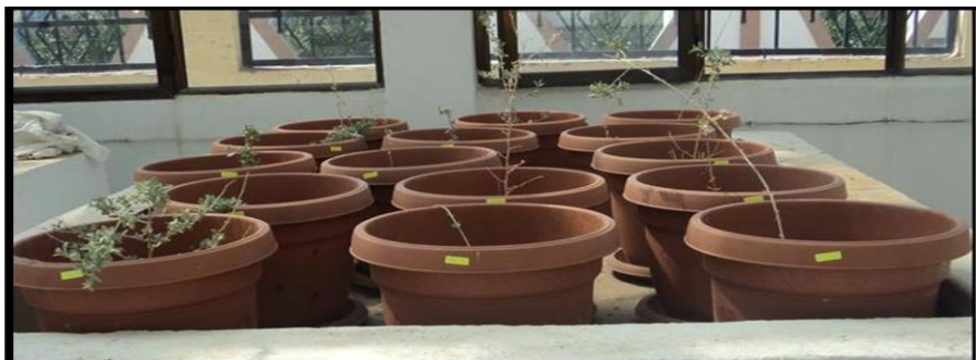
Figure 1 : Dispositif expérimental de Atriplex halimus