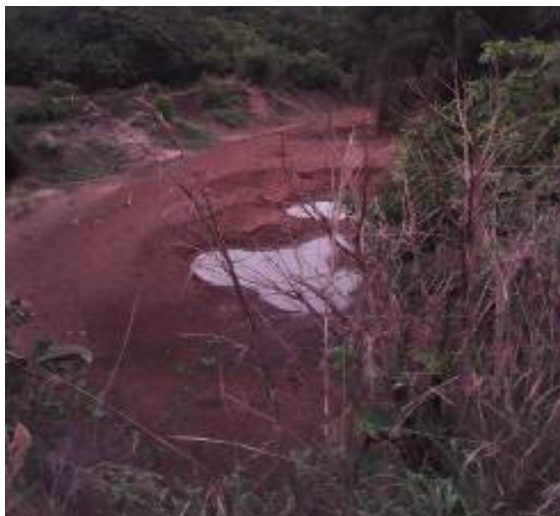
Photo1 : source d'eau tarie à Savè