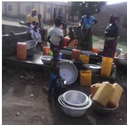
Photo2 : attroupement autour d'une pompe à Savè

Les photos 1 et 2 montrent qu'en saison sèche, les sources d'eau naturelles s'assèchent, ce qui entraîne des attroupements au niveau des pompes.