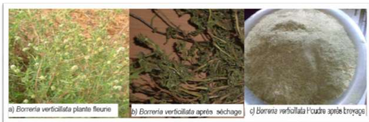
Figure 1 : Borreria verticillata (a) plante fleurie, b) plante entière après séchage, (c) poudre après broyage

Diop. L'échantillon a été séché à l'ombre, à la température ambiante (25°C) dans l'enceinte du Laboratoire de Chimie Analytique et Bromatologie de Dakar. Après séchage, un broyeur électrique de marque AGREX a été utilisé. La poudre obtenue a été conditionnée et conservée dans un sachet propre pour des analyses.