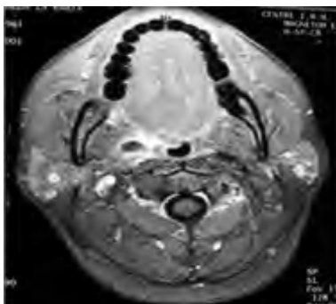
Figure 3 : IRM cervicale séquence T1 : formation de signal intermédiaire para-amygdalienne droite avec périphérie en hypersignal

Une ponction cytologique a été pratiquée dans 16 cas, ayant