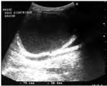
Figure 1: Echographie cervicale : masse anéchogène à paroi régulière

rétro-angulo-mandibulaire dans 2 cas et jugulo-carotidienne dans 27 cas (haute dans 21 cas, moyenne dans 4 cas et basse dans 2 cas). Un trismus a été noté dans un cas. Cette masse était rénitente dans 7 cas, ferme dans 11 cas et molle dans 17 cas. La peau en regard était inflammatoire dans 3 cas. Une fistule en regard a été notée dans 3 cas. Un bombement parapharyngé a été noté dans un cas. Vingt neuf patients ont eu une échographie cervicale ayant montré une masse kystique dans 23 cas (figure 1).