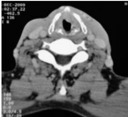
Fig. 1 : Scanner cervical : Processus tumoral de la corde vocale gauche.