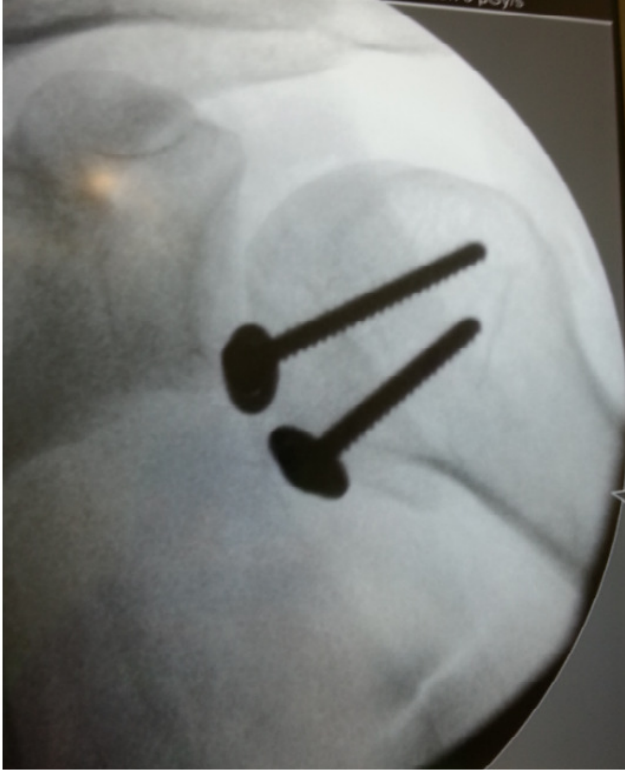
Figure 5: Image scopique post opératoire de l'épaule montrant la réduction de la luxation après stabilisation par 2 vis