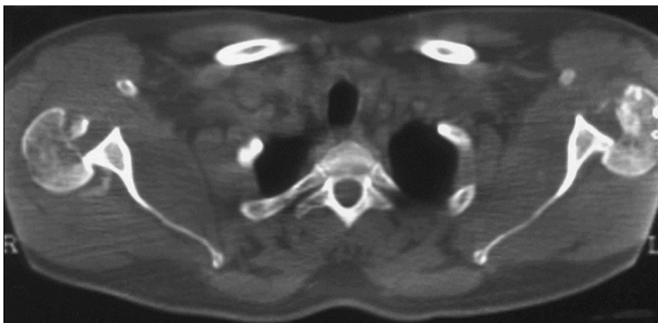
Figure 2: Coupe scannographique objectivant une luxation postérieure de l'épaule avec une encoche céphalique antérieure