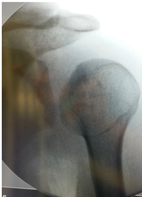
Figure 1: Image scopique de face montrant une luxation postérieure de l'épaule gauche