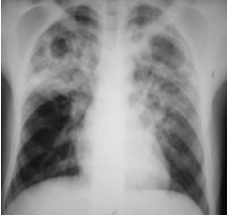
Figure 3: Infiltrats excavés des deux champs pulmonaires avec prédominance aux apex