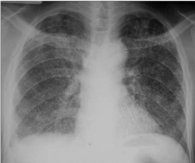
Figure 4: Opacités micronodulaires disséminées dans les deux champs pulmonaires (Miliaire)