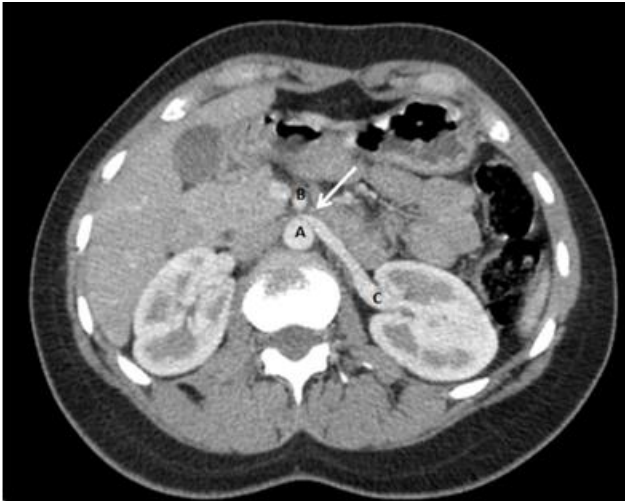
Figure 1: coupe axiale scanner abdomino-pelvien avant et après injection de PDC, signe du bec (flèche) qui désigne au niveau de la fourchette aorto-mésentérique; A) aorte abdominale; B) artère mésentérique supérieure; C) la compression de la veine rénale gauche; ratio diamètre portion hilare et aorto-mésentérique de la veine rénale gauche, 6,47 (>4,9), remplissant les critères diagnostic du SCN