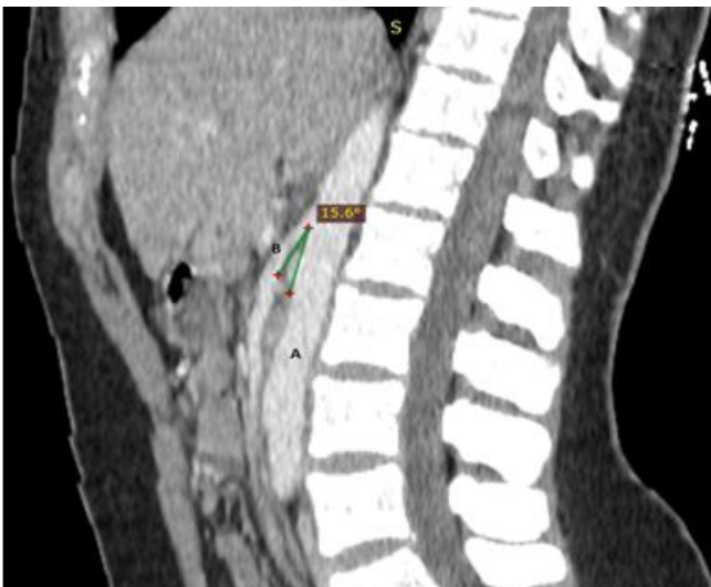
Figure 2: coupe sagittale scanner abdomino-pelvien avant et après injection de PDC; A) angulation entre l'aorte abdominale et l'artère mésentérique supérieure; B) moins de 41° (mesuré à 15,6°), remplissant les critères diagnostic du SCN