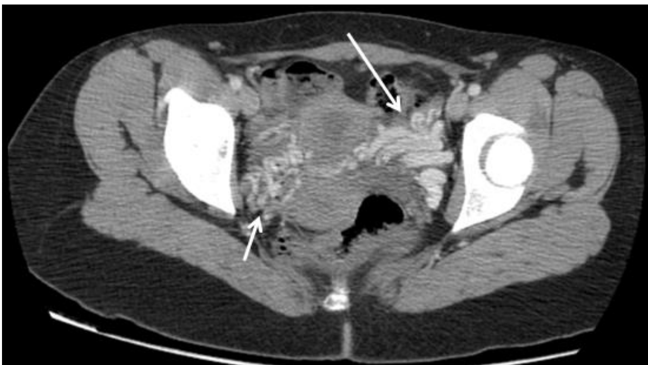
Figure 4: coupe axiale scanner abdomino-pelvien avant et après injection de PDC; circulations veineuses collatérales (varices pelviennes) (flèches)