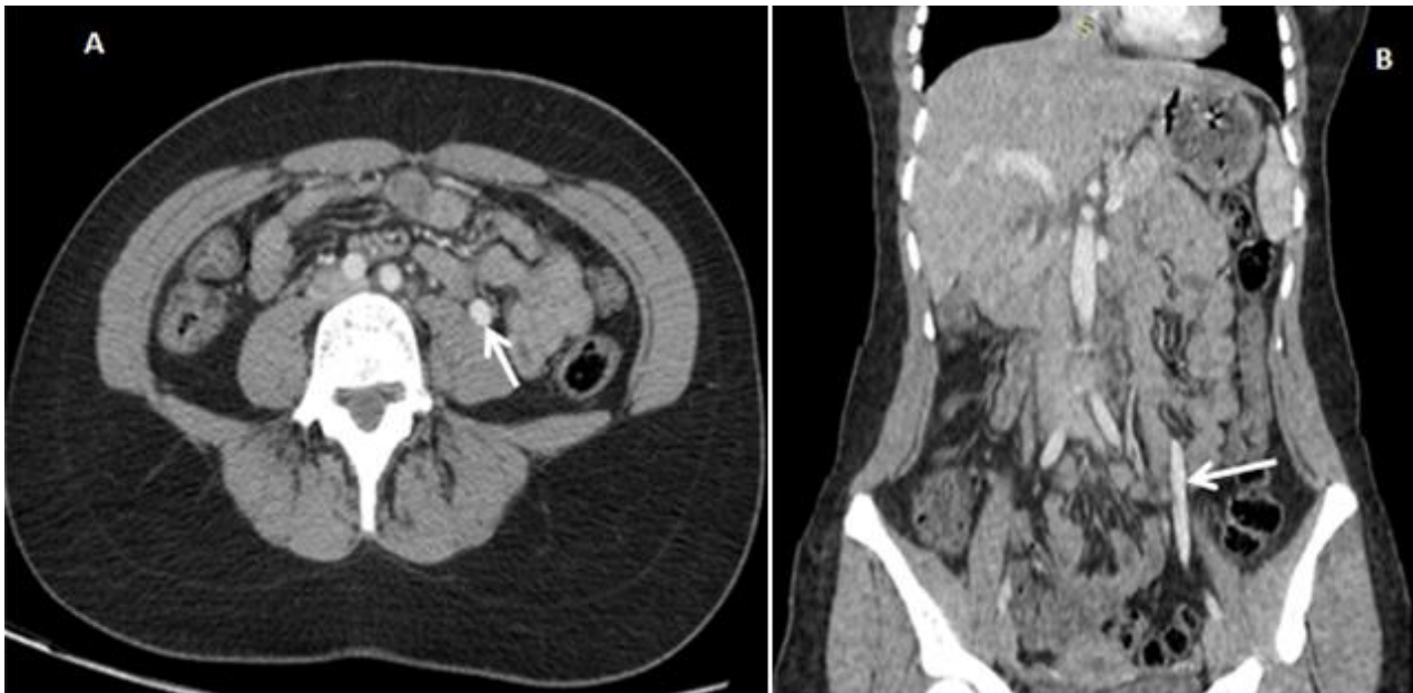
Figure 3: A) coupes axiale; B) coronale scanner abdomino-pelvien avant et après injection de PDC; dilatation de la veine ovarienne gauche (flèche)