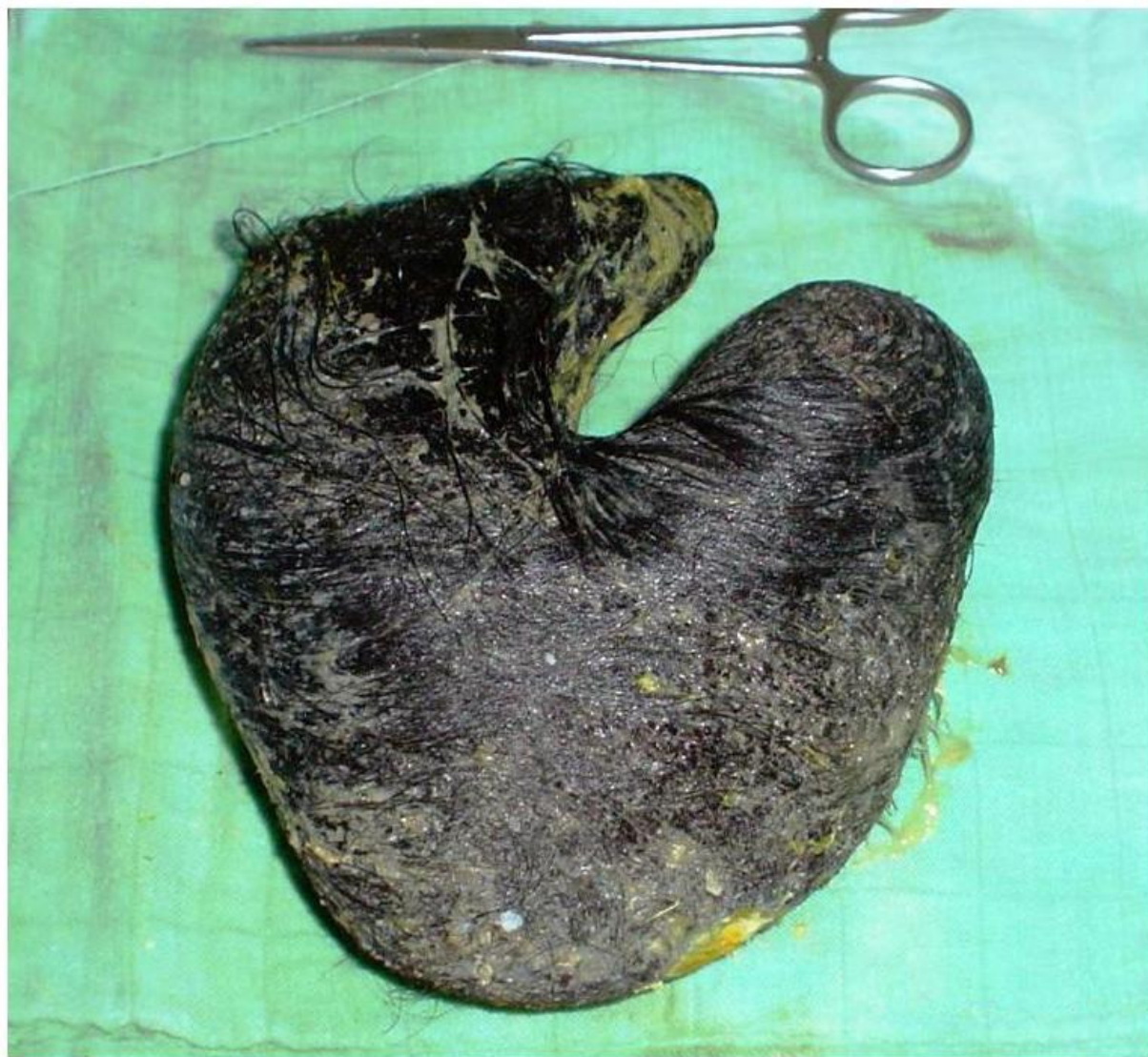
Figure 2 Trichobezoar après sont extraction