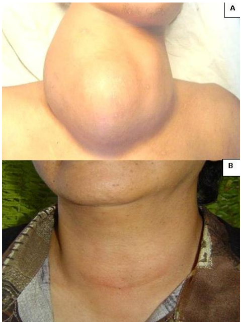
Figure 2: (A) gros goitre multi nodulaire opéré sous anesthésie locale; (B) aspect de la plaie opératoire six mois après