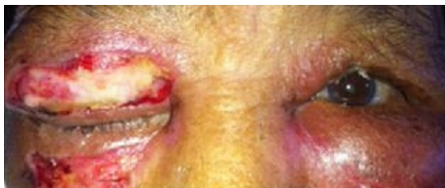
Figure 1: Cellulite préseptale bilatérale compliquant un traumatisme de la face