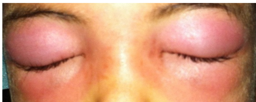
Figure 2: Aspect de cellulite préseptale compliquant une ethmodite chez un enfant de 08 ans