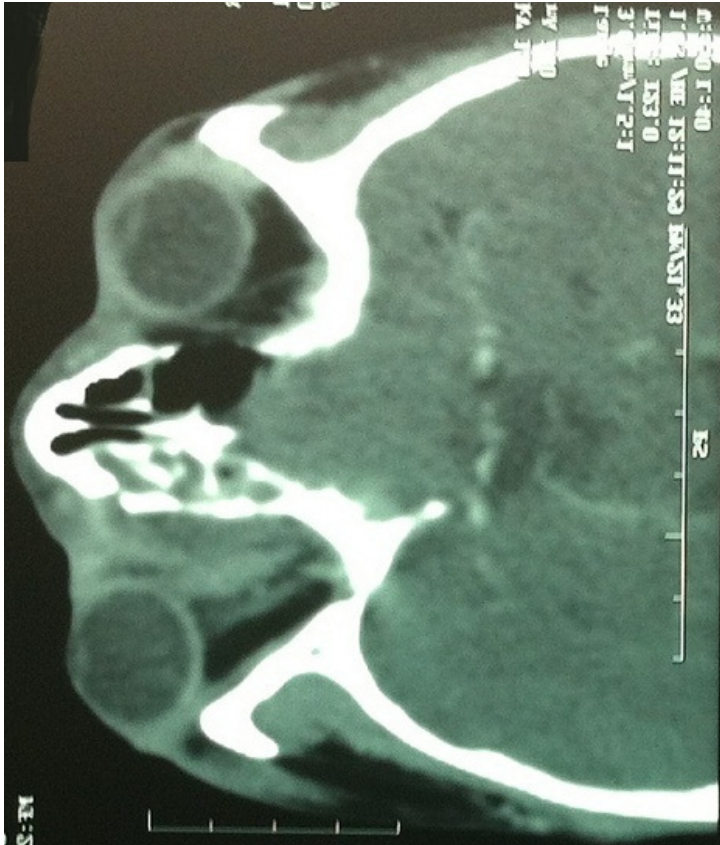
Figure 5: TDM orbitaire en coupe axiale montrant un abcès sous périosté