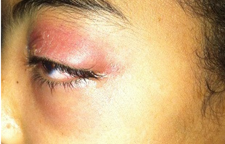
Figure 3: Aspect de cellulite rétroseptale au stade d'abcès sous périosté