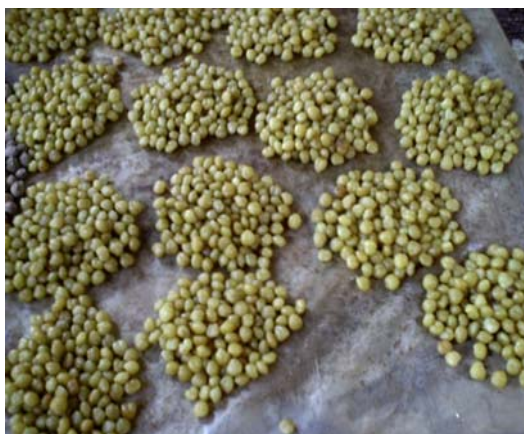
Figure 3: Graines de Ricinodendron heudelotii (Baill.) Pierre ex Pax (Euphorbiaceae)