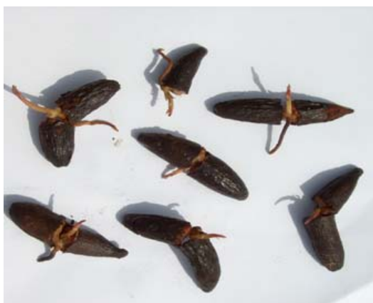
Figure 1: Fruits germés de Beilschmiedia mannii (Meisn) Benth. et Hook ; (Lauraceae)