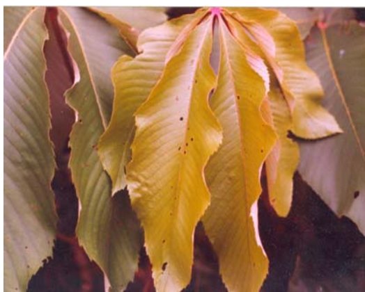
Figure 2: Jeunes feuilles de Myrianthus arboreus P. Beauv. (Euphorbiaceae)