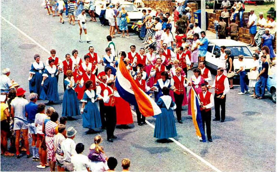
Die Suid-Afrikaanse groep loop deur die strate van Mosselbaai tydens die Diasfees The South African group walking through the streets of Mossel Bay during the Dias festival