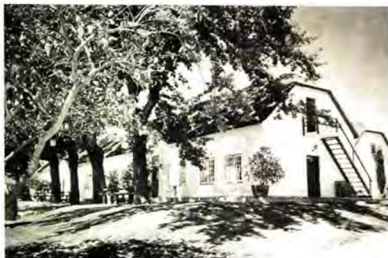
Een van die deftige wonings wat verteenwoordigend is van 'n klein deeltjie van die Hugenote nalatenskap wat steeds besigtig kan word in die pragtige wynlande van die Kaap

"Their arrival at the Cape was one of the fortunate moments in South African history. There were only about two hundred of them, but they have influenced South Africa out of all proportion to their numbers."