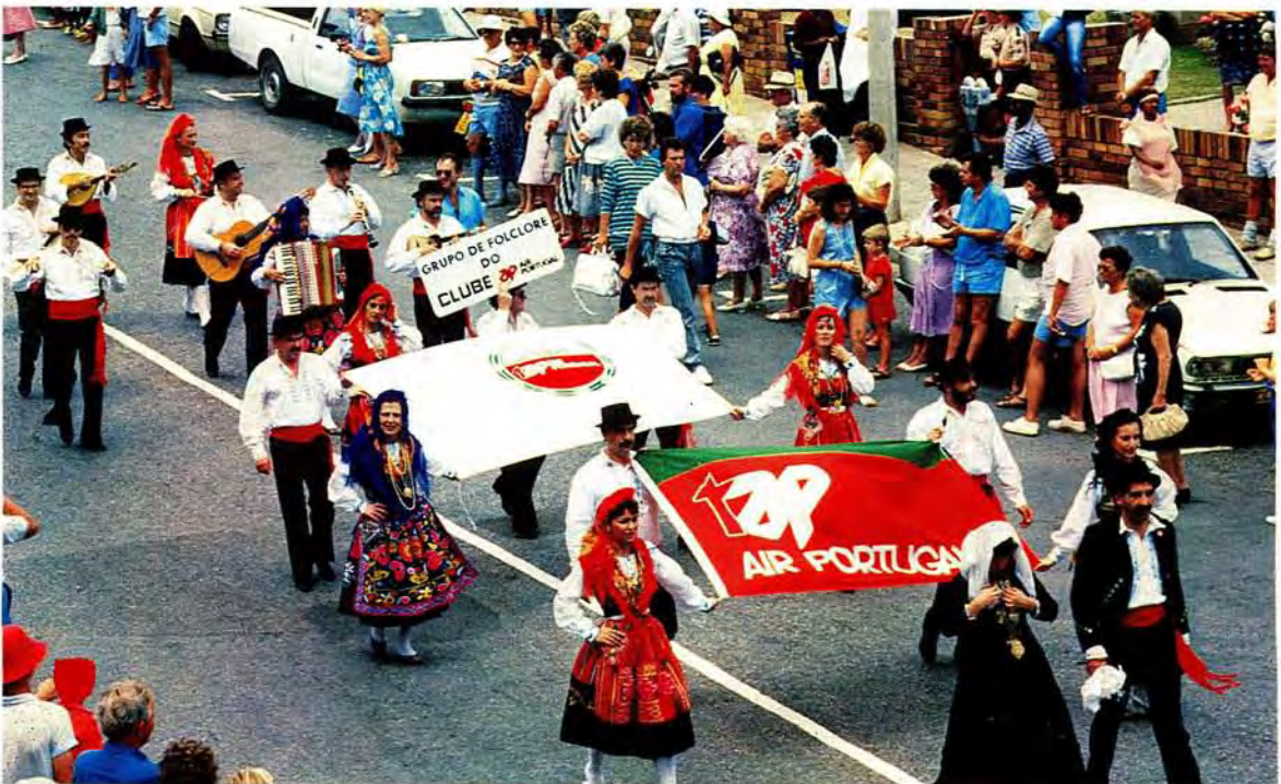
Dias Festival 1988. The Portuguese group in the streets of Mossel Bay