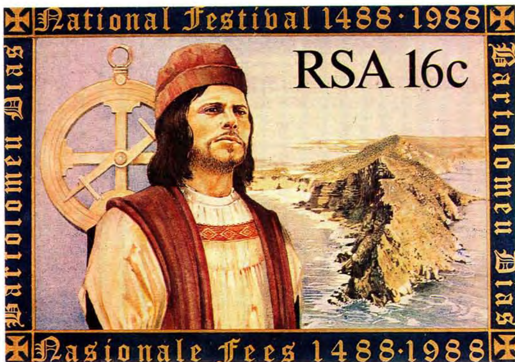
A likeness of Bartolomeu Dias, drawn by Cape Town artist Sheila Nowers, appears on one of the four commemorative stamps for the Dias celebrations in South Africa

Restourasie van die Ou Meule by Mosselbaai om die nuwe maritime museum te huisves. Op die voorgrond word uitgrawings gedoen om plek te maak vir die plasing van die replika van die karveel