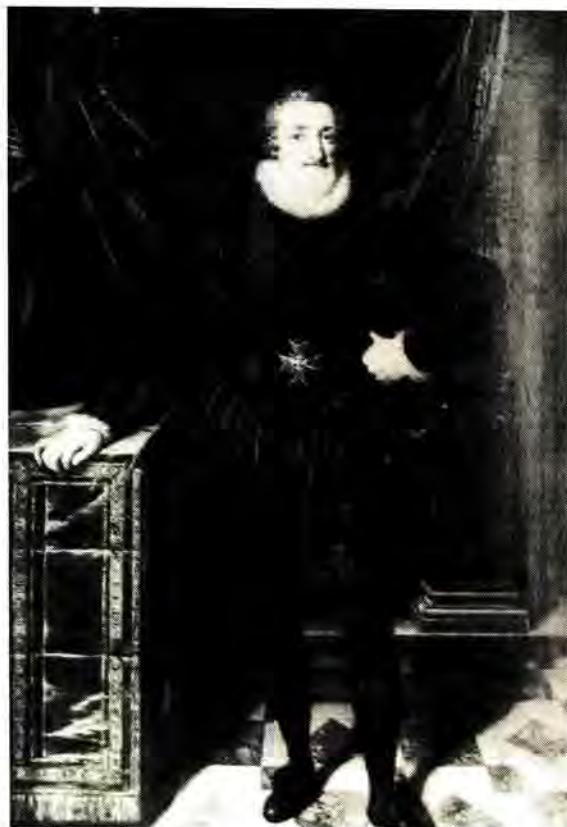
Die Hugenote leier Hendrik van Navarre wat die Franse troon in 1589 bestyg het om die eerste Bourbon Koning van Frankryk te word. Hy het die Edik van Nantes uitgevaardig in 1598 wat aan die Hugenote bepaalde regte verleen het en wat hulle teen vervolging beskerm het