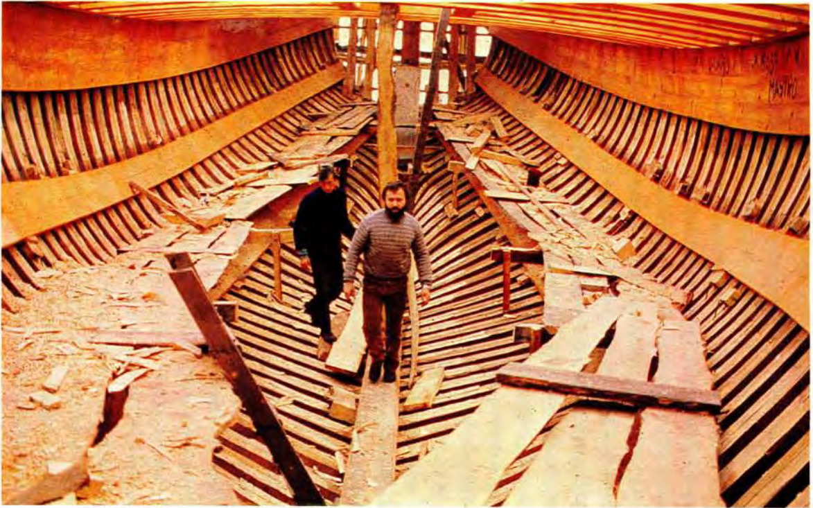
The replica caravel under construction in the shipyard of Samuel and Filhos in Vila do Conde near Oporto in Portugal. The vessel was designed by naval architects under the direction of Admiral Rogério S de Oliveira