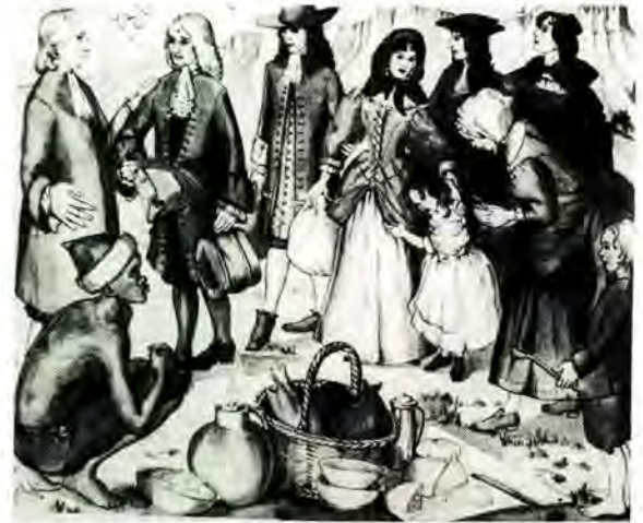
Die Hugenote arriveer haweloos in die Kaap aangesien hul al hul besittings in Europa moes agterlaat. Hulle is voorsien van basiese boumateriale en voedselvoorraad vir 'n paar maande