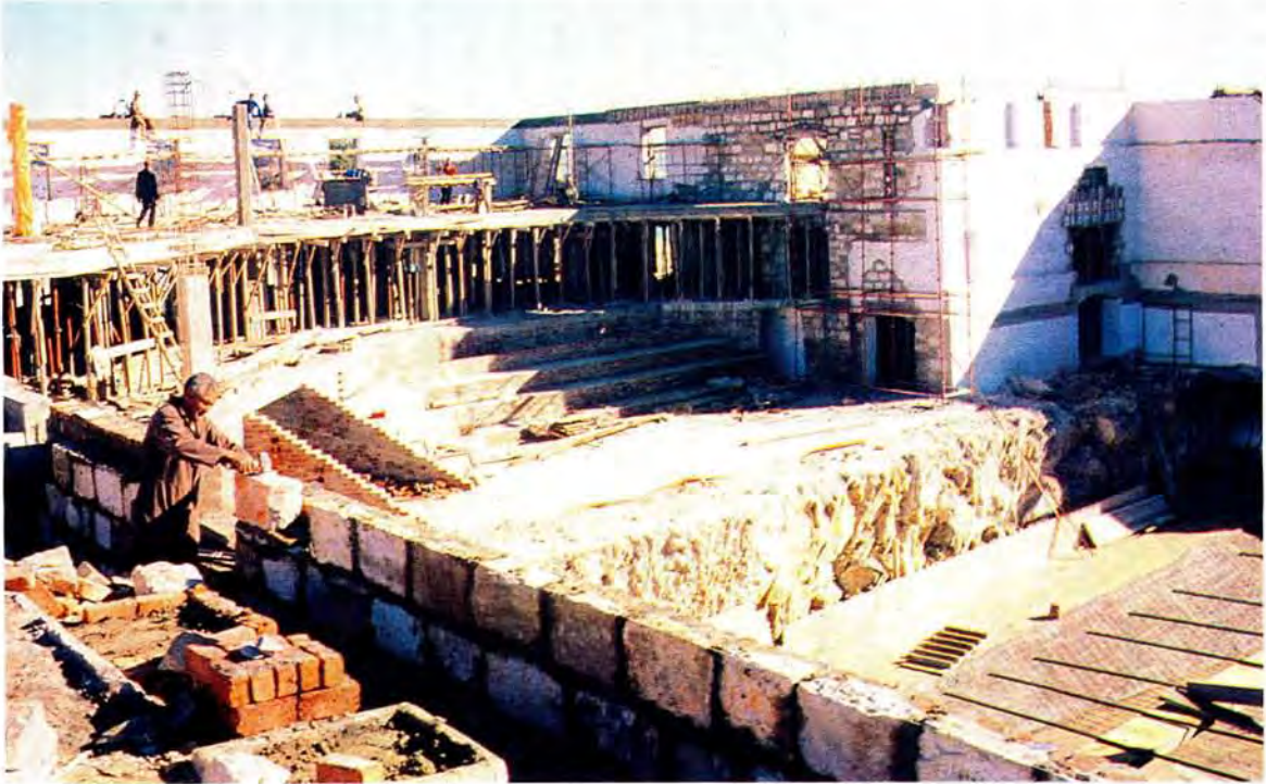
Restoration of the Old Mill at Mossel Bay to house the new maritime museum. In the foreground excavations are underway for space to house the replica caravel

Restourasie van die Ou Meule by Mosselbaai om die nuwe maritime museum te huisves. Op die voorgrond word uitgrawings gedoen om plek te maak vir die plasing van die replika van die karveel