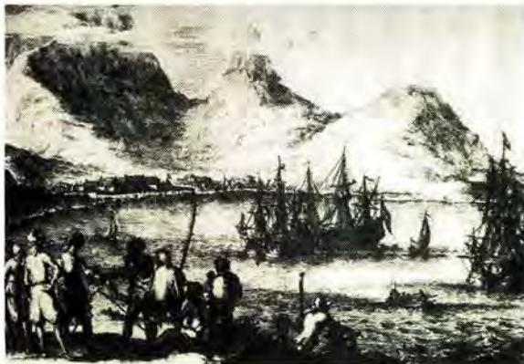
Die Tafelbaaise strand was teen die laat 1670's 'n miernes van aktiwiteit, maar die blanke nedersetting daar was nog maar baie klein

"Their arrival at the Cape was one of the fortunate moments in South African history. There were only about two hundred of them, but they have influenced South Africa out of all proportion to their numbers."