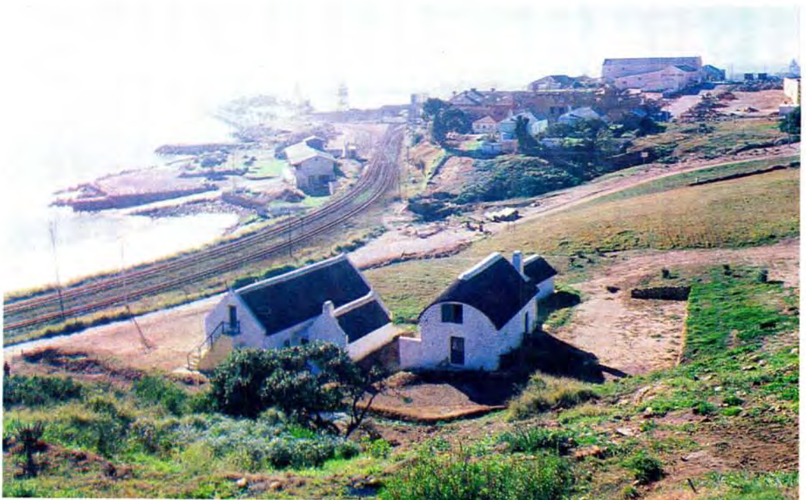
The bay where Dias first landed on South African soil at Sao Bras (later Mossel Bay) 500 years ago. In the foreground are the restored cottages of Alexander Munro (C 1830)

'n Skildery van Dias besig om 'n kruis te plant op die Eiland van St Croix, Algoabaai in Februarie 1488