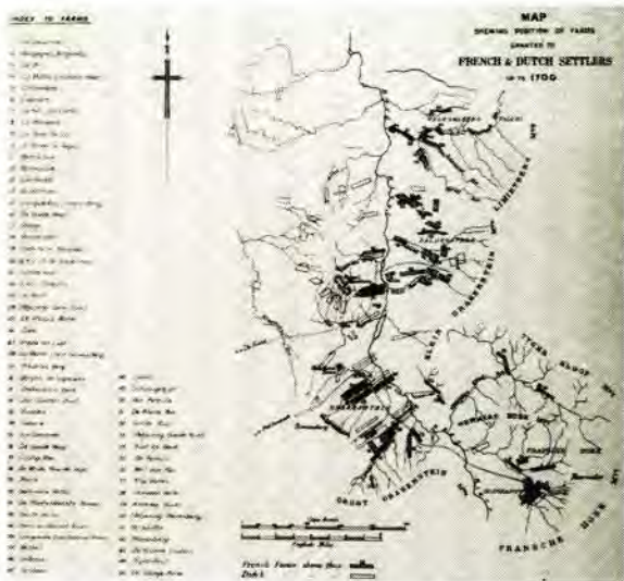
Kaart van die plase toegesê aan Franse en Nederlandse Setlaars tot en met die jaar 1700