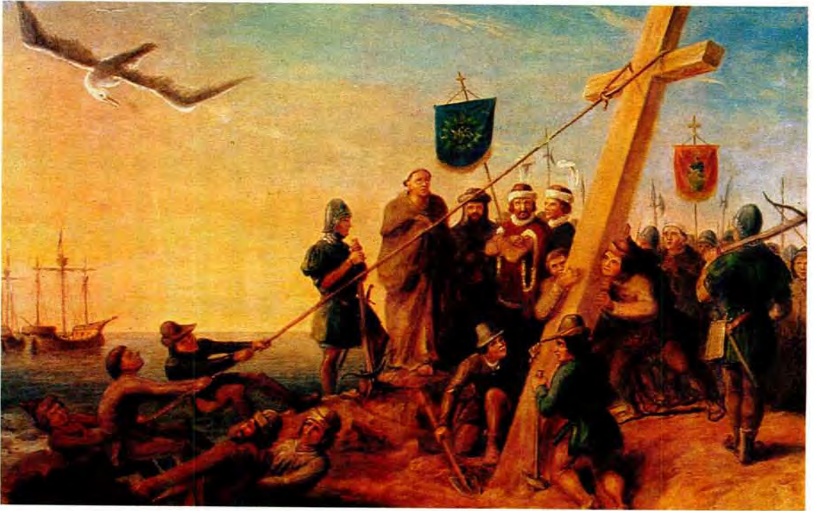
A painting of Dias planting a cross on the Island of St Croix, Algoa Bay in February 1488

'n Skildery van Dias besig om 'n kruis te plant op die Eiland van St Croix, Algoabaai in Februarie 1488