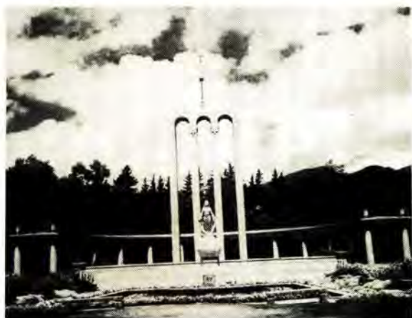
Die Hugenotemonument te Franschoek

In 1939 het die destydse voorsitter van die Sentrale Hugenote-feeskomitee, senator F.S. Malan, hom – saam met sy mede-komiteeëde – beywer om op 'n passende wyse herdenkingsplegtighede voor te berei.