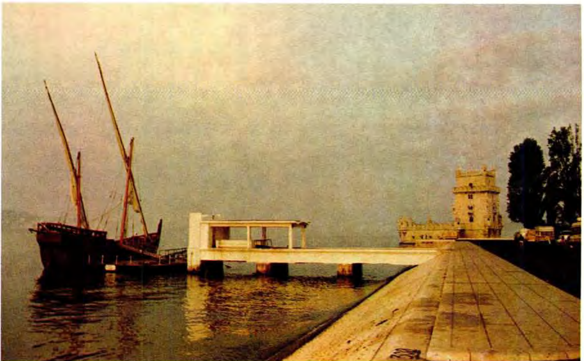
Die karveel geanker by die plek waarvan sy voorgangers vertrek het. Die Belem Toring vanwaar die Portugese koning sy seevaarders vaarwel toegewif het op hulle reise gedurende die 15de eeu, kan regs op die foto gesien word The caravel moored at the point where its ancestors departed from. The Torre de Belem, from where the Portuguese king saluted his seafarers farewell on their voyages during the 15th century, can be seen on the right