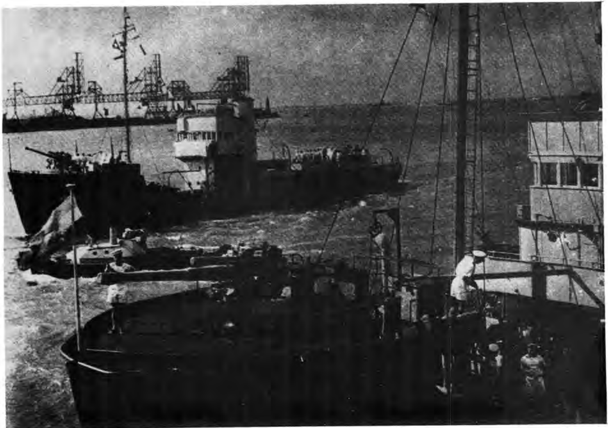
Die duikbootjagvaartuig, H.M.S.A.S. Southern Maid.

Om 13h40 die volgende dag nader die konvooi weer Tobruk. Skielik duik vyf duikbomwerpers op 7 000 voet op die konvooi af – met S.S. Helka