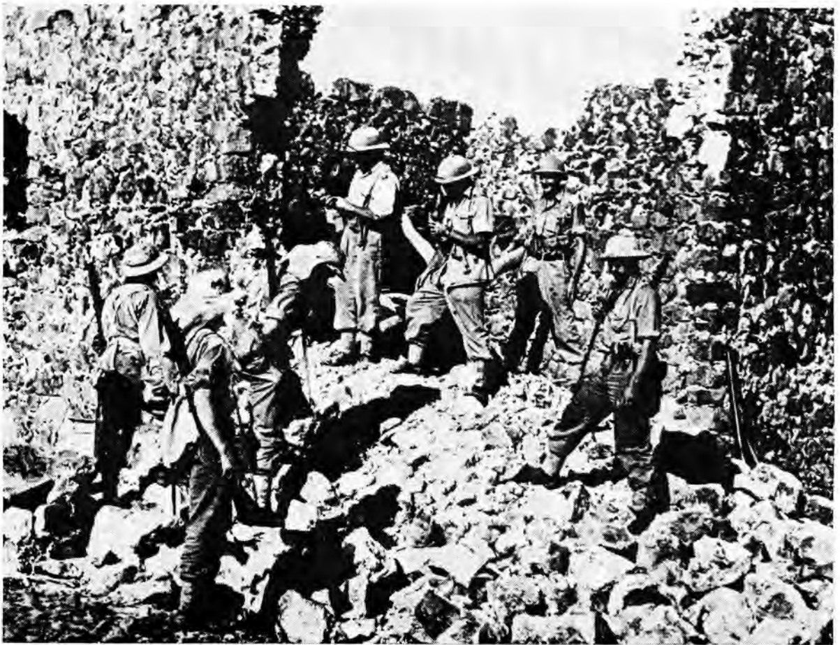
'n Deel van die puin van die sentrale blokhuis by Hobck waaruit vyandelike masjiengeweeuskutters voortdurend op die aanvallende Suid-Afrikaners gevuur het. Die lyke van twee Italiaanse masjiengeweermaats is later onder hierdie kliphoop ontdek. Veral 'n tweepondtenkafweerkanon het sy deel meesterlik bygedra om wanorde in die rustige vyandelike blokhuis te saai en dit tot puin te omskep