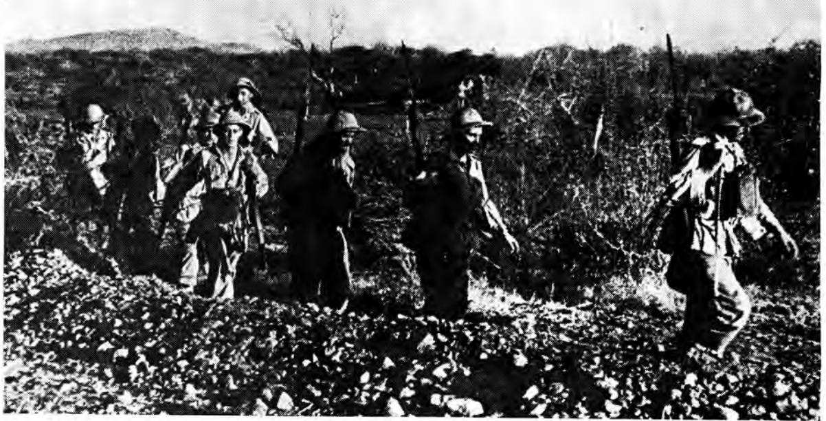
Voetsoldate van die eenheid 1 SA Irish beset die vyan Jalike loopgrawe tydens die inname van die dorpie El Gumu

slag hulle maklik. Omdat twee ander van die pantserkarre wat met 'n wye omvleuelingsbeweging gestuur is om die terugtog by te kom, tegnies die gees gee en onklaar raak, ontsnap sommige van die vyand wel.