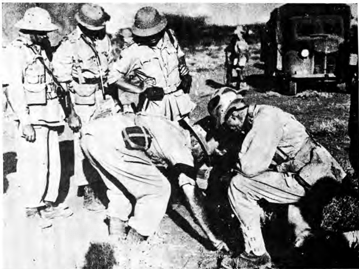
Een van die inligtingsoffisiere, 'n majoor, verbonde aan 5 SA Infanteriebrigadegroephoofkwartier, teken 'n sketsplan vir die beplande aanval op Hobok in die sand ter verduideliking aan die twee infanteriebataljonbevelvoerders. Die Springbokaanmars en -aanval is gekenmerk deur puik voorafbeplanning en leierskap

die 1 SA Irish, wat by El Gumu deur 2 SA Infanteriebrigadegroep, ná laasgenoemde se sukses by Gorai, afgelos is.