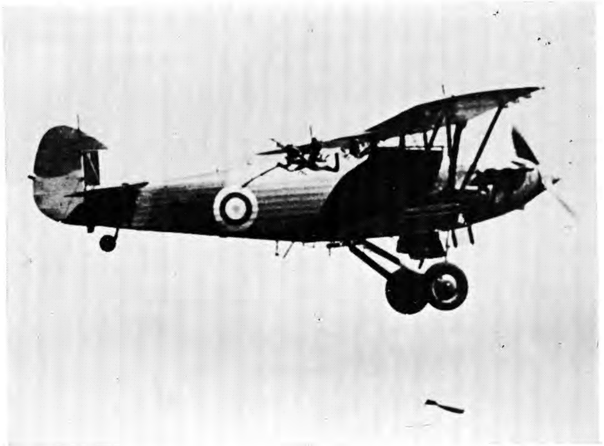
Op hierdie wyse bombardeer 'n Suid-Afrikaanse Hartbeest die stellings by Hobok voordat dit deur die vyand afgeskiet word