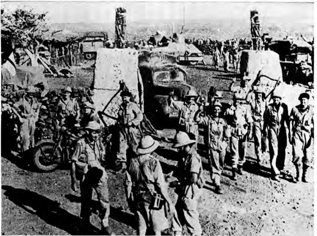
Gelukkige, glimlaggende Suid-Afrikaanse soldate stap u't by die hek van die Hobokfortifikasie 'n paar uur ná hul doelgerigte besetting deur middel van verskeie dienswapens en korpse van hierdie belangrike Italiaanse buitepos

in die versekering van buigsamheid teen die vyand, en andersyds in die moontlikmaak van 'n konsentrasie van hoogs diverse dienswapens op vyandelike doelwitte. Veral waar die vyand self eensydig was in sy opleiding, voorbereiding en toerusting vir oorlog, het die verskeidenheid van middele waarmee die Springbokke hom getakel het spoedig verwarring gesaai.