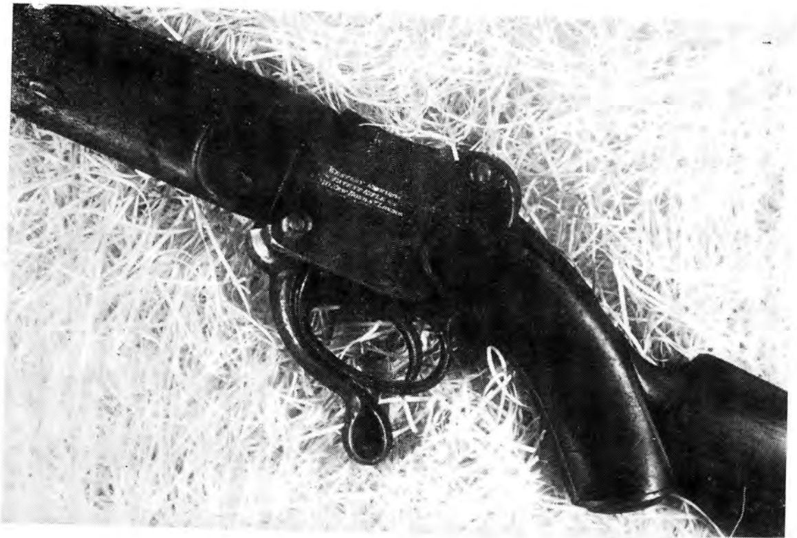
Foto's van burgers na die Slag van Majuba toon duidelik dat sommige van hulle met valsot Westley Richards en ook met Winchesters gewapen was.